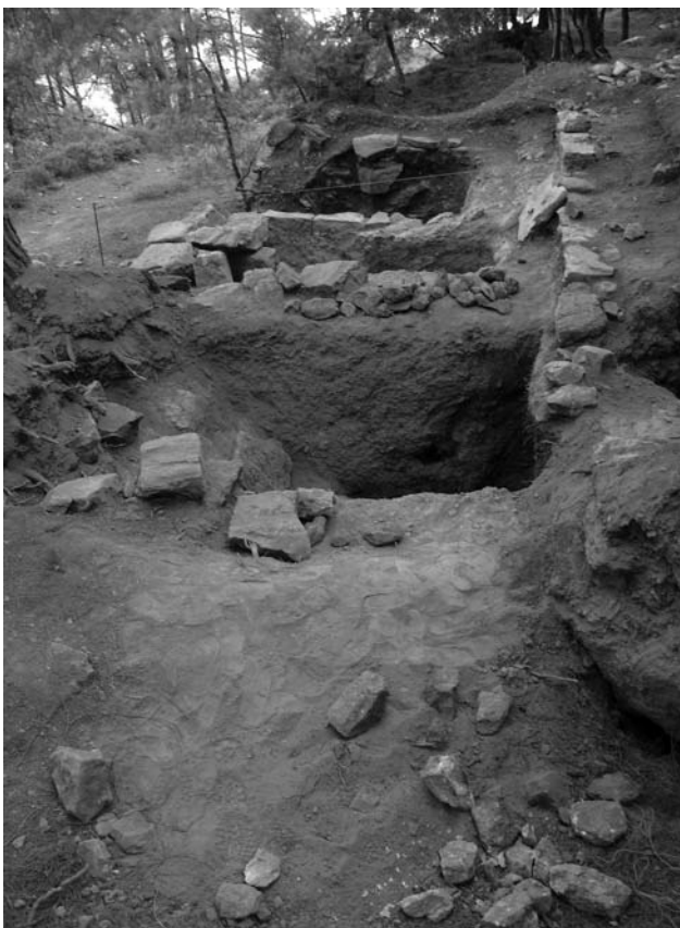
Εικ. 48. Ρόδος. Κυμισάλα. Ο ταφικός περίβολος από Ν.

τάφο. Ο τάφος ήταν συλημένος, ωστόσο από το εσωτερικό του συγκεντρώθηκε λύχνος του βου αι. μ.Χ.